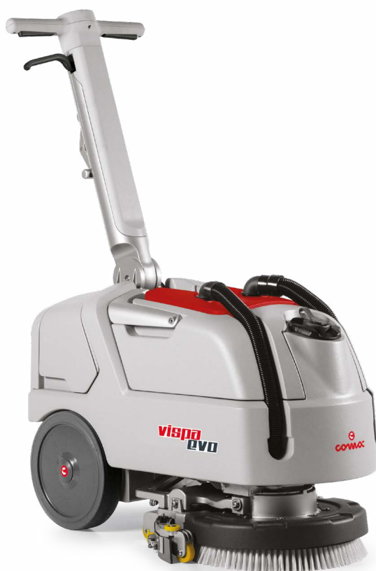
VISPA EVO B

Version avec brosse à disque Piste de travail : 350 mm