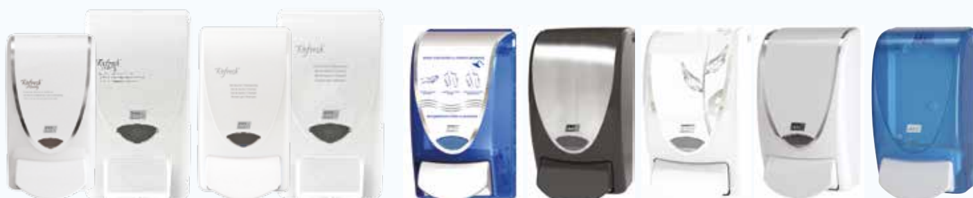
RSH1LDSSTH RSH2LDPSTH RHB1LDSSTH RHB2LDPSTH PR000P PR000BRUSH PR000WHICR CHR1LDS TBL1LDS