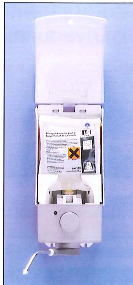
Vue interne Divermite